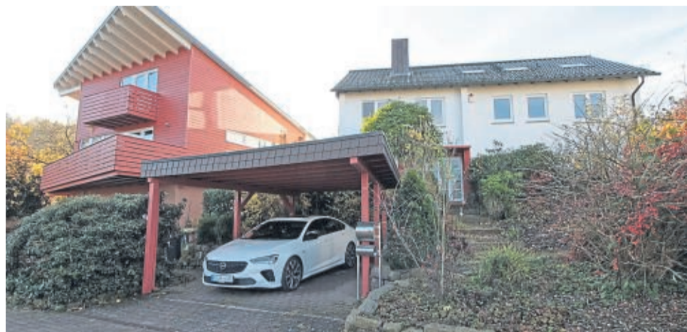
Die Gebäude an der Straße Brückenhof: Hier soll das Angebot für therapeutisches Wohnen entstehen.

Um den Mädchen ein passendes, reizarmes Umfeld zu geben, in denen sie neues Vertrauen schöpfen können, habe sich die Immobilie in Nieste angeboten. „Der Ort ist gut angebunden und hat eine tolle Versorgung. Drum-